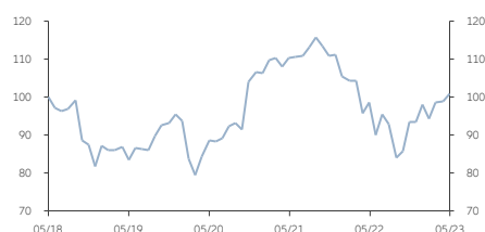
■ A類 (美元) 收息股份